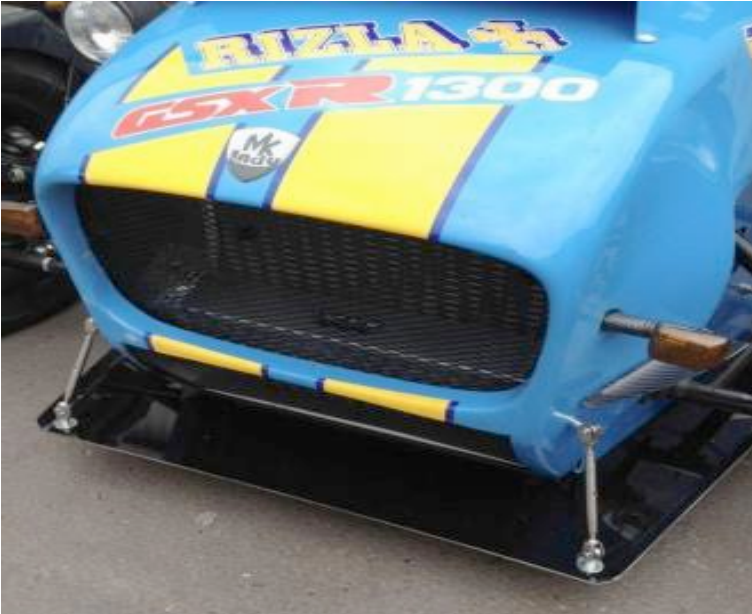
Figur 3 Viser frontsplitter for biler med klassisk karosseri iht. Pkt. 238.3.4 i Teknisk reglement for Super Seven Racing.